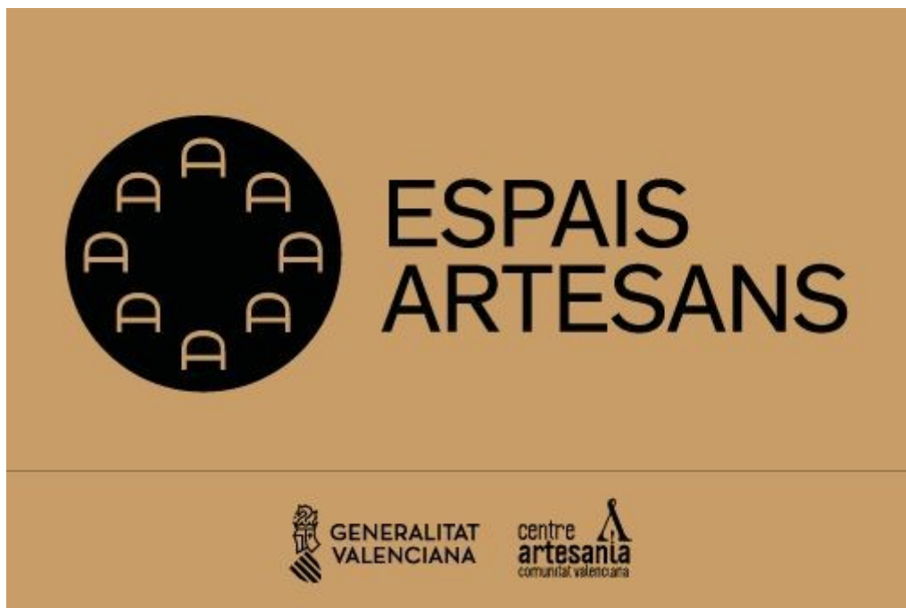
Imagen corporativa del proyecto Espais Artesans , de la Generalitat Valenciana

Recientemente, en 2024, el museo ha sido reconocido como Espacio Artesano por parte del Centro de Artesanía de la Comunidad Valenciana.