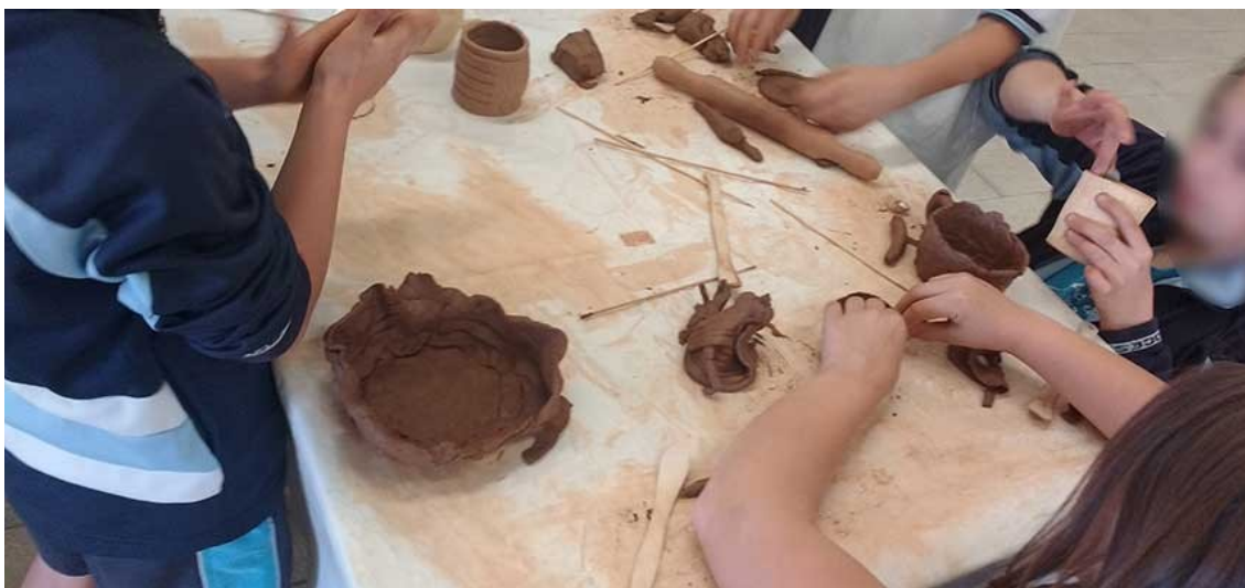
Taller de manipulación de barro con herramientas de madera

Por otra parte, dentro del objetivo fijado de reducción del cuso de plástico en las actividades didácticas, se ha implementado una serie de acciones con el fin de fomentar el uso de otros materiales más sostenibles en la realización de los talleres didácticos en las salas del museo. Como ejemplo, se han eliminado los utensilios de modelaje de plástico por los de madera, al tiempo que se utilizan piezas tradicionales de cerámica para contener el agua que se emplea durante los talleres, en lugar de los de plástico.