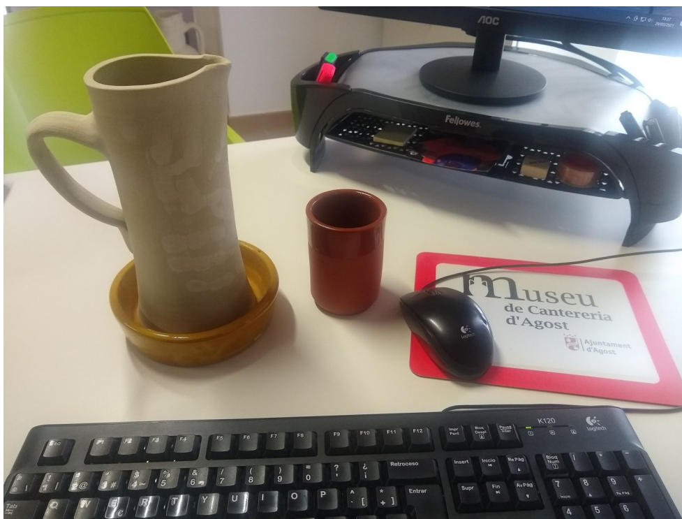
Uso de piezas de cerámica en las oficinas del museo