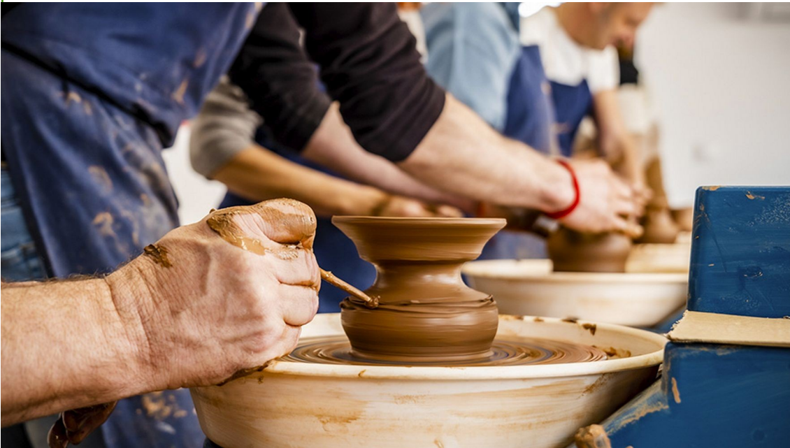
Taller de torno en el museo

Por otra parte, un grupo de público importante es el que conforman las asociaciones culturales, centros de educación especial, centros ocupacionales o aulas de la tercera edad. Se trata de colectivos dinámicos, con una mayor movilidad geográfica que otros y, generalmente, con buena disposición a visitar museos como el de Alfarería.,