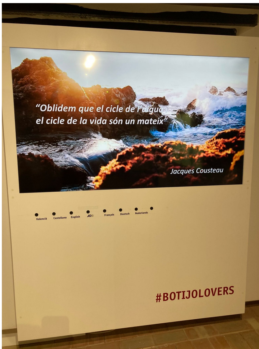
Audiovisual de la campanya #botijolovers