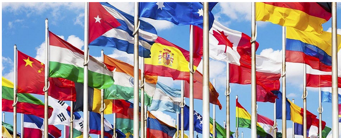
En la provincia de Alicante residen personas de más de 130 nacionalidades distintas

Los grupos de interés del museo o el público objetivo es, en gran medida, el escolar, pero no exclusivamente. Alicante es una de las provincias con un mayor número de residentes extranjeros (solo por detrás de Madrid y Barcelona), por lo que es un público importante que, además, suele estar sensibilizado con la artesanía y la protección del patrimonio cultural.