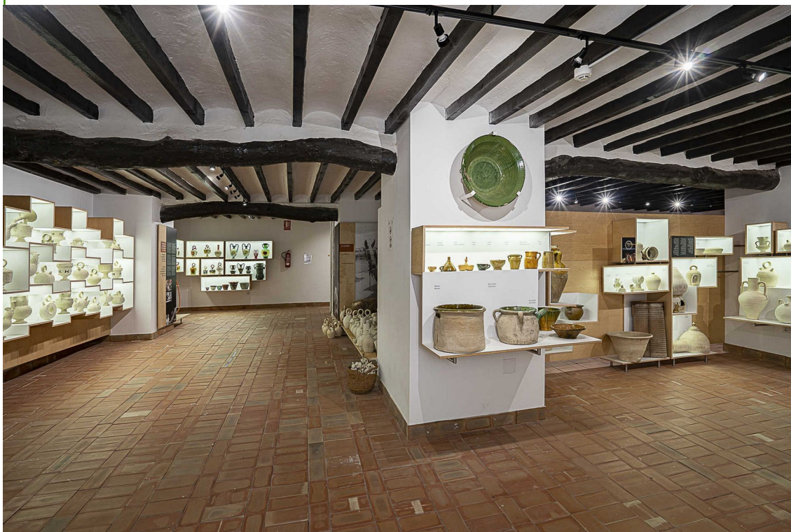
Sala permanente del museo

Por su parte, desde el año 2000, las donaciones recibidas en el museo pasaron a formar parte de la Colección Municipal. Al igual que en el caso anterior, los fondos son heterogéneos en cuanto a su composición, por cuanto incluyen objetos relacionados con los trabajos agrícolas, así como con los oficios relacionados con la alfarería y piezas de procedencia diversa. En conjunto, se trata de una colección amplia que incluye más de 2.500 piezas, siendo la que actualmente sigue creciendo con donaciones particulares, superando los 5.000 objetos el conjunto de todas las colecciones que gestiona el museo.