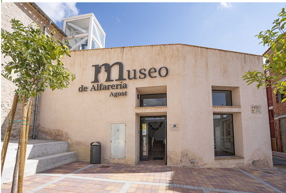
Fachada del museo

El Museu de Cantereria o Museo de Alfarería de Agost es una institución pública cuyo titular es el Ayuntamiento de Agost. Se ubica en una antigua alfarería, por lo que el continente es un edificio histórico, catalogado como de interés arquitectónico local, mientras que el contenido forma parte del Patrimonio Cultural tanto material como inmaterial.