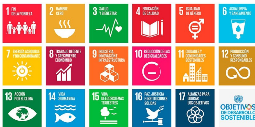
Objetivos de Desarrollo Sostenible (ODS)

Prueba de ello es la aprobación en 2021 de la Agenda Urbana 2030 / Agost , que define las estrategias y compromisos del Ayuntamiento de Agost por el cumplimiento y aplicación de los ODS en el municipio.